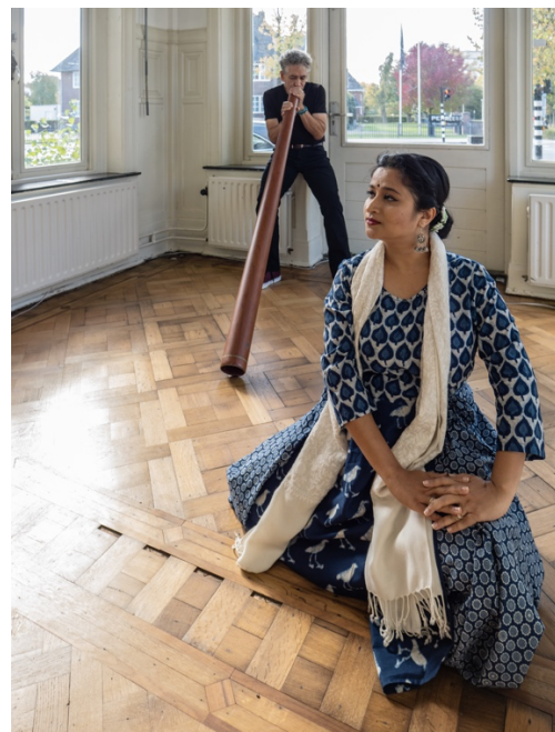
Burning Blood Groep

De tweede “fling” was een mini expo door de International Creative Women (ICW) in samenwerking met het Albert van Abbehuis onder de titel “Part Of A Whole”. 10 kunstenaars van buitenlandse afkomst die hier in de regio wonen lieten samen hun werk zien aan 200 bezoekers in een weekend van vrijdagavond tot zondagmiddag.