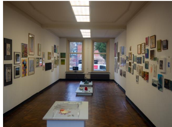
Benefiet voor Brabant