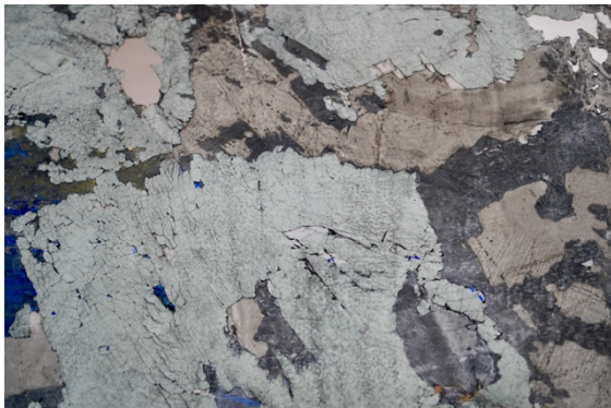
Werk van Ana Leonor Madeira Rodrigues

Ana heeft gedurende haar residentie periode bij Make Eindhoven dit project gerealiseerd in 2021. Op groot formaat toont ze een uitgebreide reeks van kaarten die op verschillende wijze tot stand zijn gekomen die de bezoeker inspireren om na te denken over de huidige mondiale situatie.